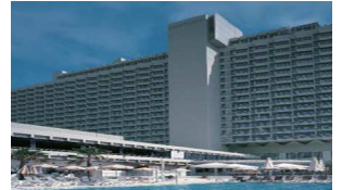
ヒルトンホテル Tel Aviv